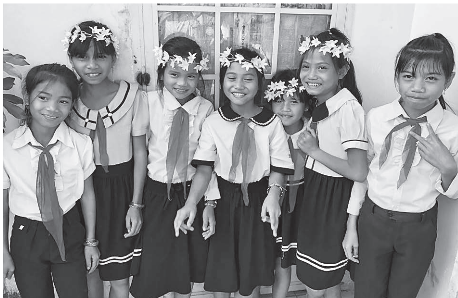
トゥモーロン郡ダックサオ小学校の子どもたち

私は東京で1年半日本語を勉強しているときに、子ども基金の仕事の手伝いをさせていただきました。お祭りでコーヒーを販売したり、毎月第3土曜日にベトナム語クラブに参加したり、子どもからの手紙を翻訳したりしました。それらの活動を通じて、いろいろな経験ができました。心からの感謝の気持ちをきれいな字で書いた手紙を翻訳するとき、すごく感動しました。母国は貧乏で、困難な環境で育ってきた子どもが多いのだと実感しました。困難な環境で育ってきた子どもたち、親がいない子どもたちは困難を乗り越えて、夢を追っていました。一番印象的なのは、父親が亡くなったけれど、一生懸命勉強し、医学部